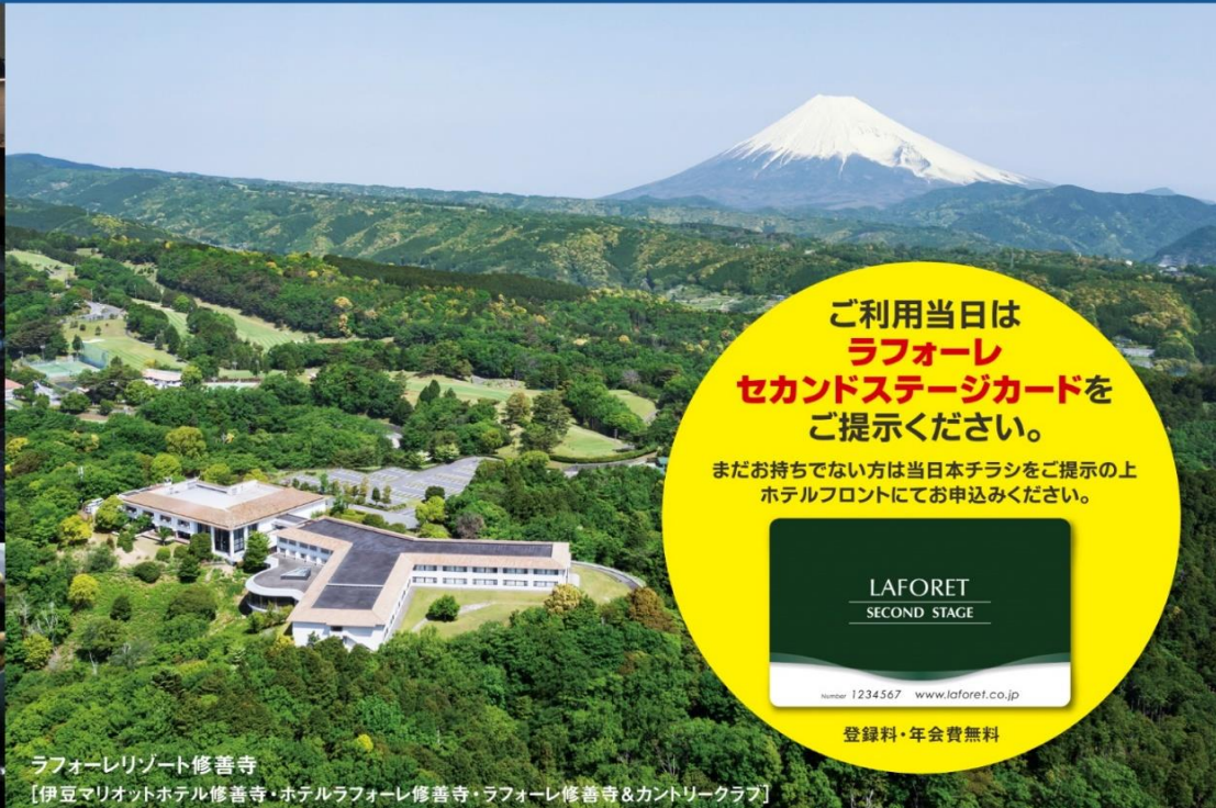
ラフォーレリゾート修善寺